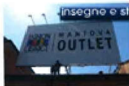
insegne e strutture